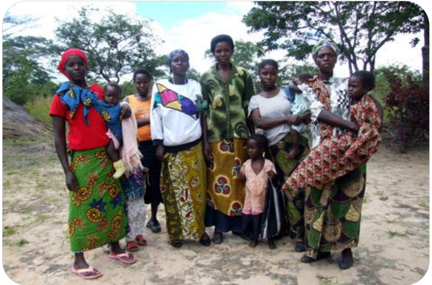
Rodzina we wsi Mukonchi, Zambia 2009.