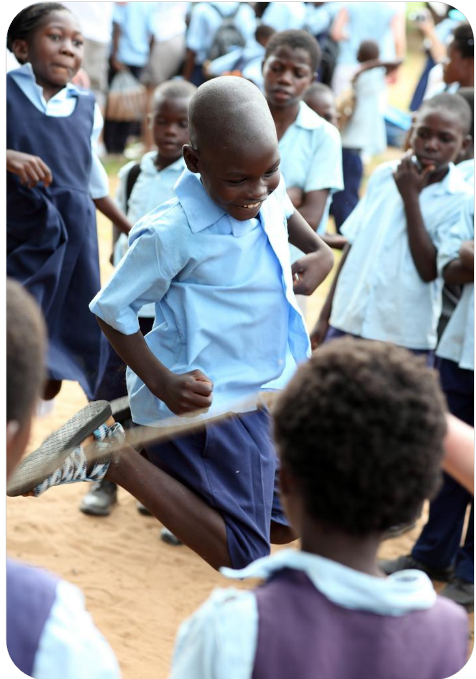
Uczniowie szkoły podstawowej w Livingstone, Zambia