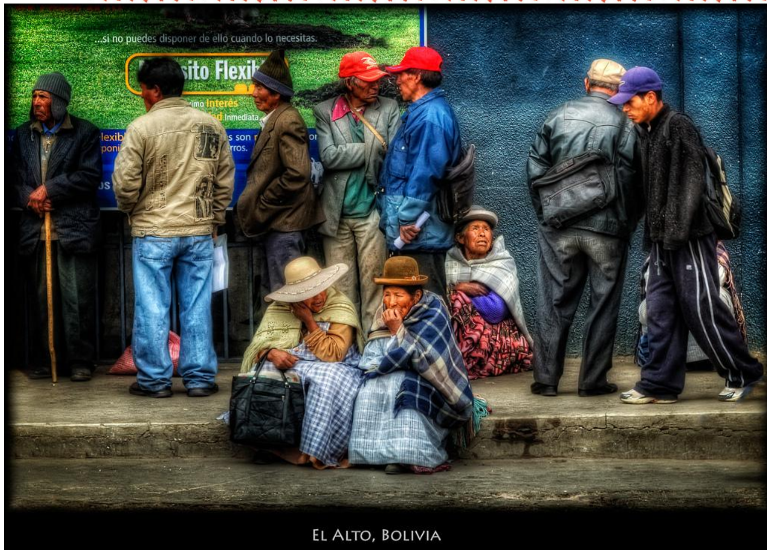
EL ALTO, BOLIVIA

http://www.flickr.com/photos/pedrosz/4116115337/